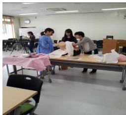
新人助産師合同研修会の様子