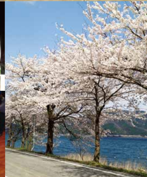
表紙風景写真: 海洋大崎にて

写真が多くなって見やすくなりました。(A・K) 研修報告など興味深い記事が多く、楽しみです。(S・Y)