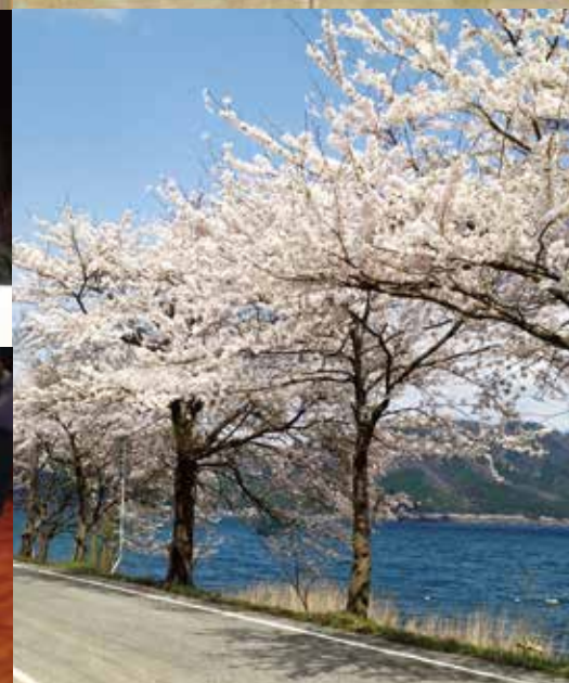
表紙風景写真: 海洋大崎にて