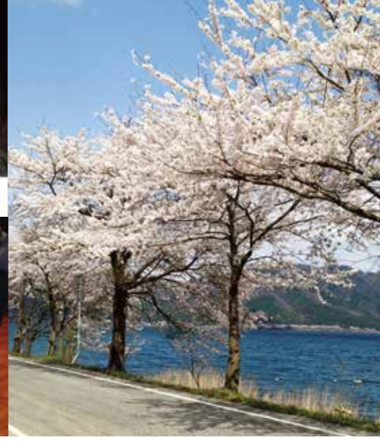
表紙風景写真: 海洋大崎にて