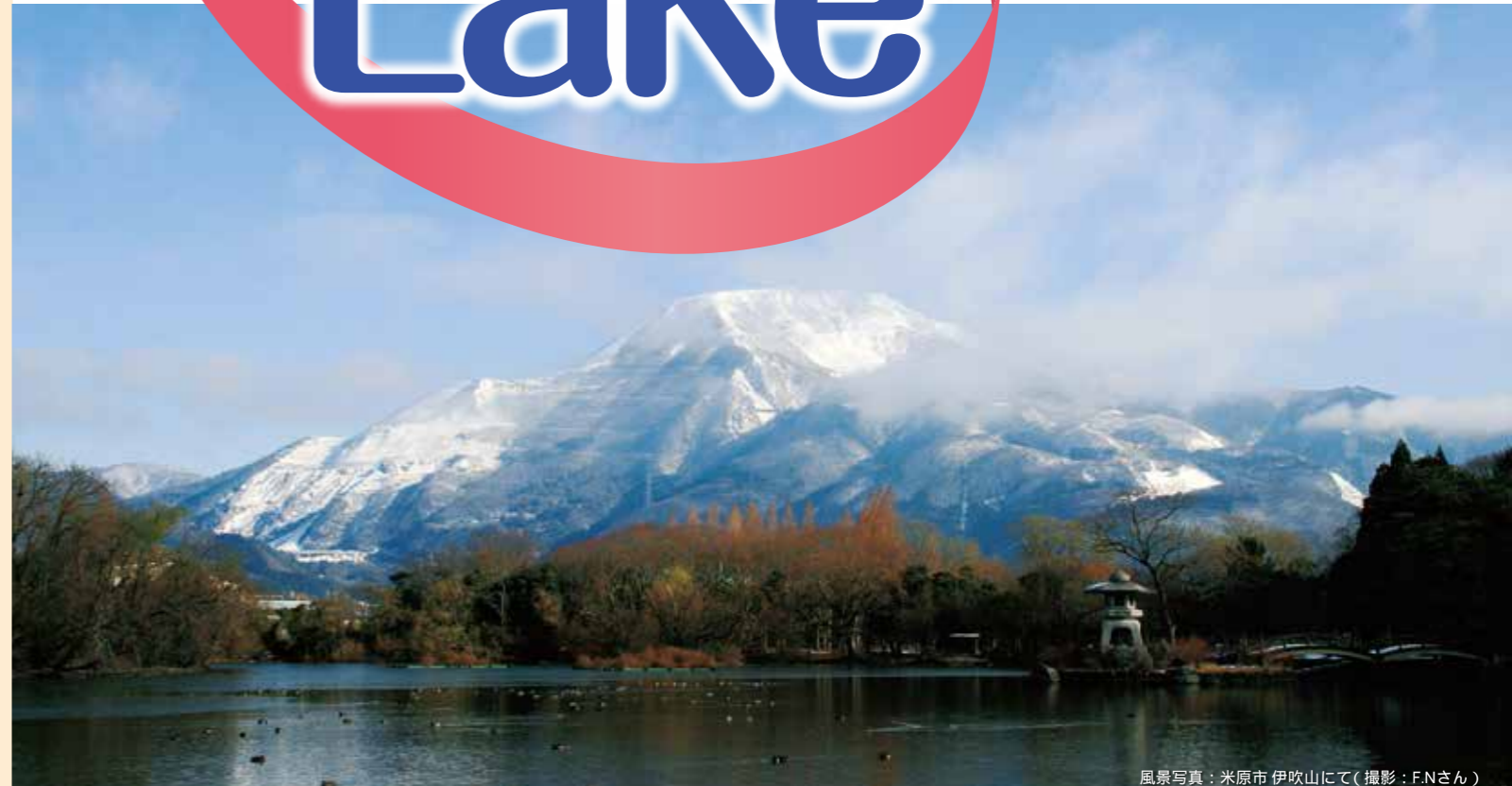
風景写真: 米原市 伊吹山にて