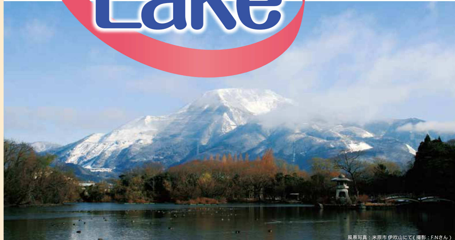
風景写真: 米原市 伊吹山にて