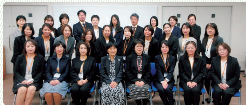
令和7年8月26日～10月31日 共に学んだ26名

本研修の開催にご尽力いただいた看護協会ならびに関係者の皆様に心より感謝申し上げます。