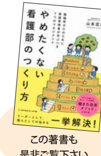
この著書も是非ご覧下さい