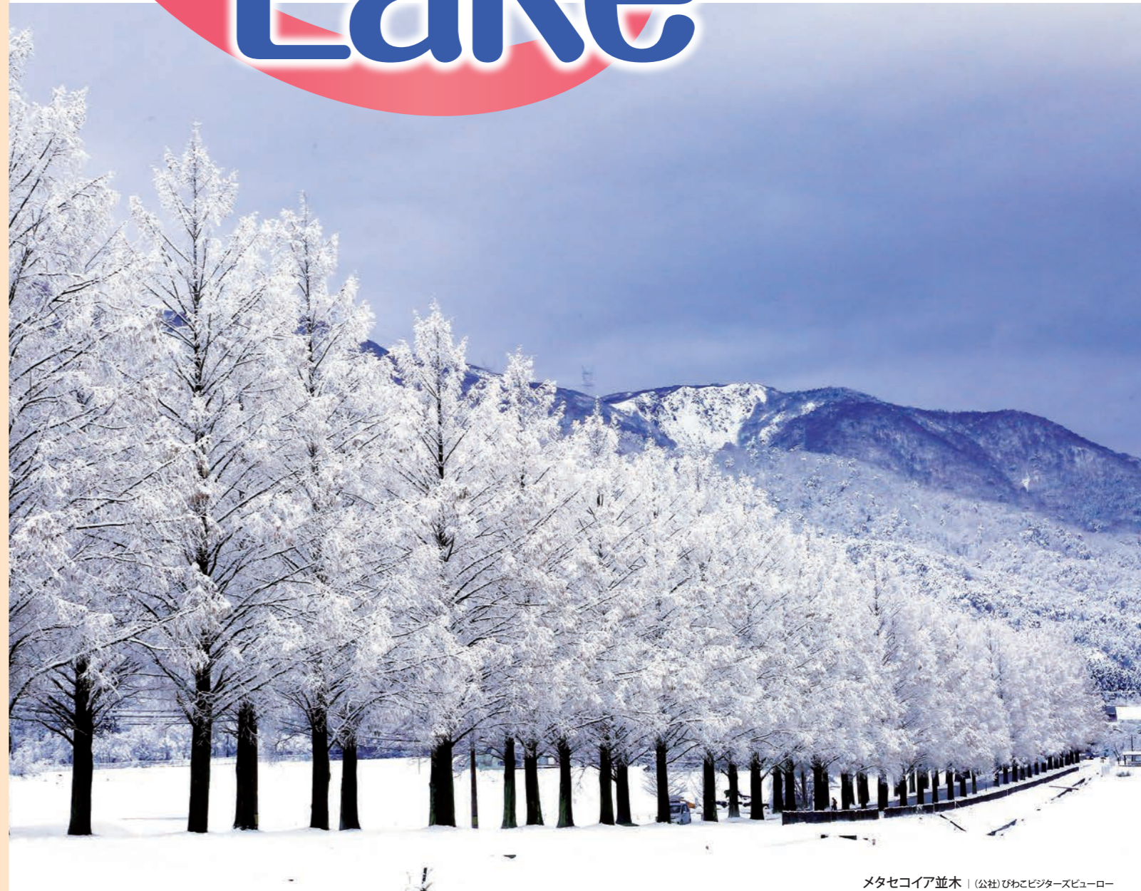
メタセコイア並木 | (公社)びわこビジターズビューロー