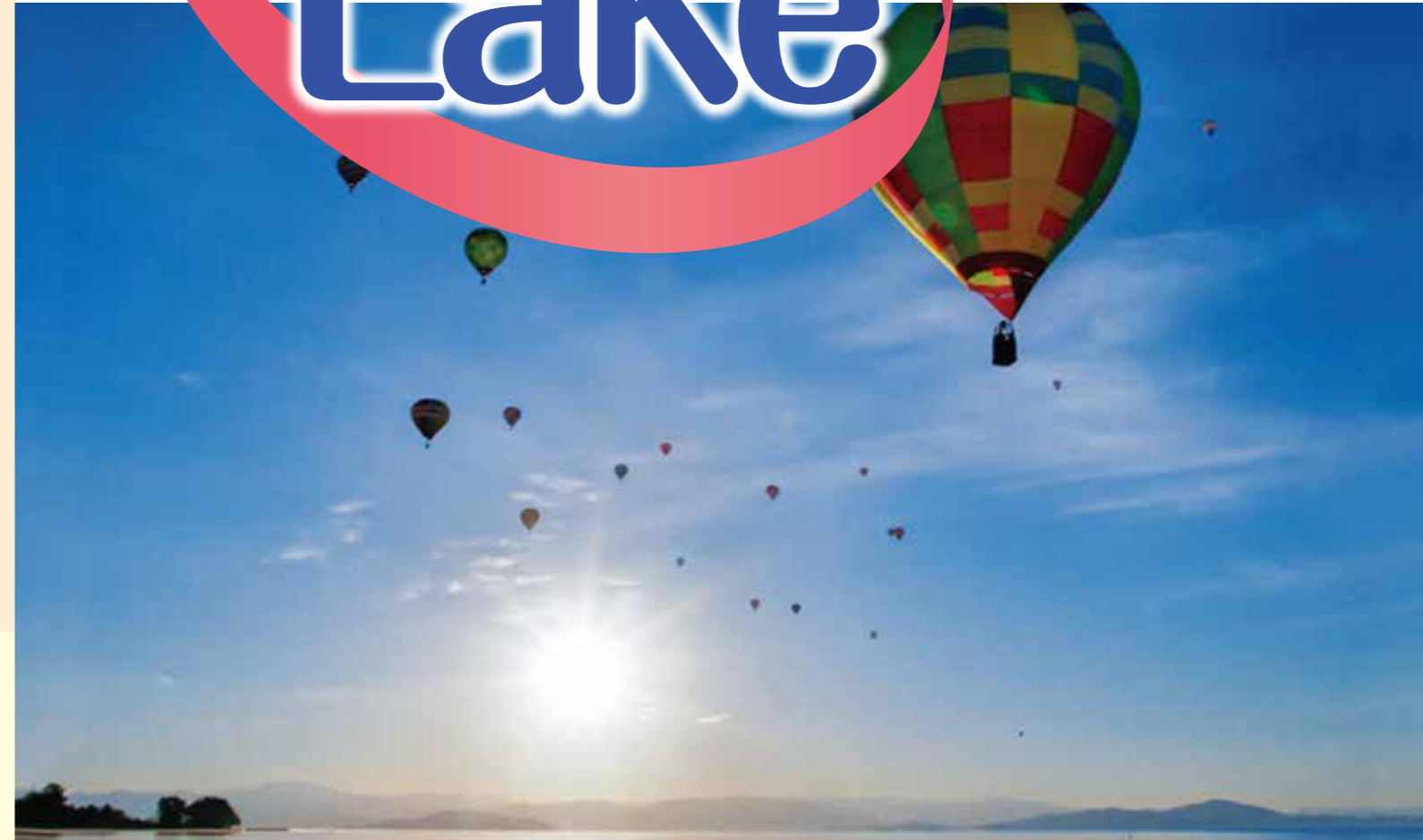
表紙風景写真(近江白浜水泳場にて)