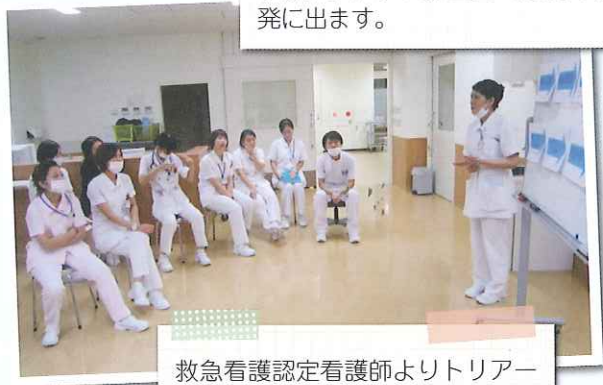
救急看護認定看護師よりトリアージについて学んでいます。実践を振り返りながら自己課題が見い出すことができる良い機会になっています。