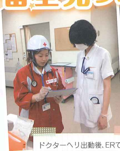
ドクターヘリ出動後、ERで患者引き継ぎの様子。

大津赤十字病院、高度救命救急センターICU/ERです。年間3万人以上の救急患者の受け入れ、全科対応の救命治療を行っています。スタッフ一丸となって命を救い、つなぐ看護を心がけ、取り組んでいます。