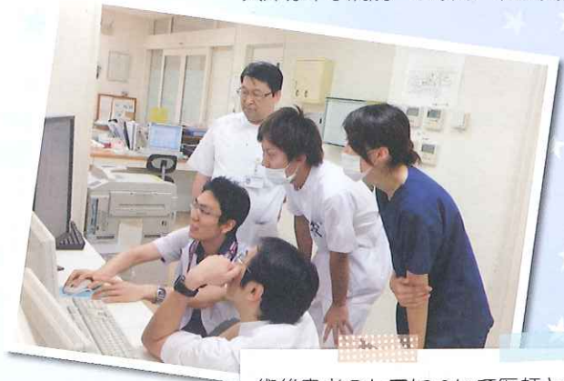
術後患者のケアについて医師と医療カンファレンスを行っている様子。話しやすい雰囲気で見解も活発に出ます。