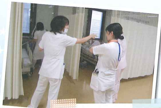
新人看護師への多重課題・時間切迫シミュレーションの様子。緊張している新人看護師に対してプラスのフィードバックを行いながら、新人看護師の成長を願って日々教育を実践しています。